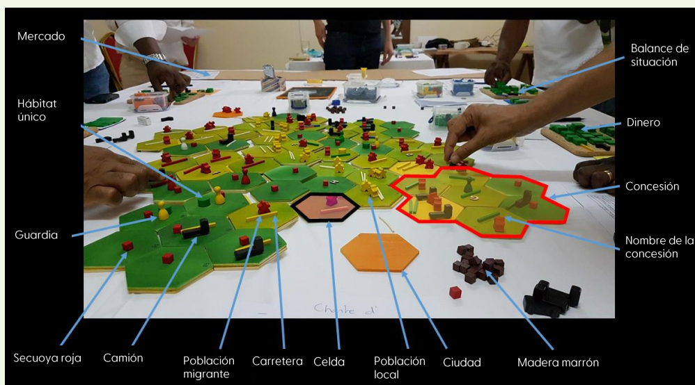
Figura 1: El modelo que representa todos los componentes del paisaje en forma física. Las celdas hexagonales constituyen el paisaje. Las fichas representan infraestructuras, recursos o personas. En función de sus estrategias, los participantes colocan fichas donde quieran invertir o regular actividades. A lo largo del diálogo tendrán que negociar acuerdos y colaboraciones con los demás participantes.

¿En qué se diferencia esta forma de diálogo de las demás? En varios aspectos. En primer lugar, el modelo ofrece a los participantes una definición común de cómo se construye el paisaje para sus diferentes usos, es decir, una base sólida para el consenso. En segundo lugar, el modelo ofrece a los participantes la oportunidad de entender el paisaje desde la perspectiva de otro grupo de actores sociales. Esto aumenta la comprensión mutua y fomenta la transparencia y la confianza. En tercer lugar, el modelo crea un espacio operativo seguro que permite ensayar experimentos, simular conflictos y probar políticas. Cuando hay (1) una definición común del sistema, (2) comprensión y confianza mutuas y (3) un espacio seguro para cuestionar la validez de las ideas de todos, las posibilidades de llegar a un consenso entre los participantes aumentan considerablemente. El diálogo sobre paisajes tiene por objeto conseguir estos 3 elementos, que formarán la base del análisis final del paisaje que se explora. El apoyo para lograrlo procede de la facilitación de los investigadores en el diálogo de 4 días.