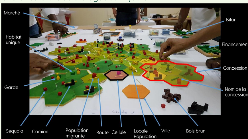
Figure 1: Le modèle représentant toutes les composantes du paysage forestier sous une forme physique. Les cellules hexagonales constituent le paysage. Les jetons représentent des infrastructures, des ressources ou des personnes. En fonction de leurs stratégies, les participants placent les jetons là où ils veulent investir ou réguler des activités. Tout au long du dialogue, ils devront négocier des accords et des collaborations avec les autres participants.

Pourquoi cette forme de dialogue est-elle différente de toute autre ? Plusieurs raisons à ceci. Tout d'abord, parce que le modèle fournit aux participants une description commune de la manière dont le paysage forestier est établie en fonction de ses différentes utilisations, une base solide sur laquelle établir un consensus. Ensuite, le modèle permet aux participants de voir le paysage forestier du point de vue d'un autre groupe de parties prenantes, favorisant une compréhension mutuelle dans le but de favoriser la transparence et la confiance. Puis, le modèle permet de créer un espace sûr où tenter diverses expériences, simuler les conflits et les politiques testées. Avec (1) une description commune du système, (2) une compréhension et une confiance mutuelles, et (3) un espace sûr pour remettre en question la validité des croyances de chacun, les chances de trouver un consensus entre les participants sont considérablement augmentées. L'objectif du dialogue sur les paysages forestiers est d'établir une base comportant ces 3 éléments pour l'analyse finale du paysage forestier exploré. Ceci sera rendu possible grâce à l'animation proposée par les chercheurs lors du dialogue sur 4 jours.